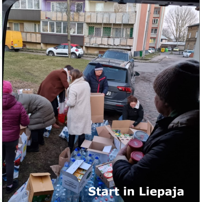
Start in Liepaja