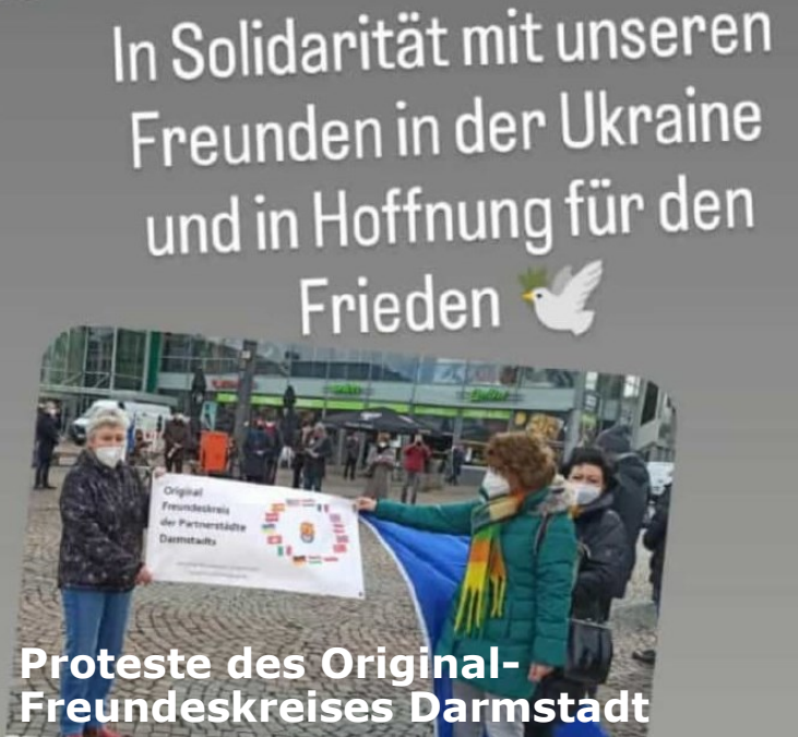
Proteste des Original-Freundeskreises Darmstadt

Impressum Darmstädter Initiative für Liepaja e.V. V.i.S.d.P. Klaus Wieland. www.initiative-liepaja.de. info@initiative-liepaja.de